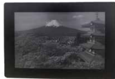
表示色:白黒16bitグレースケール